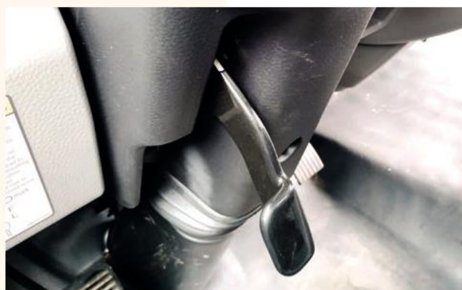
Перемещаемая по вылету и углу наклона рулевая колонка фиксируется расположенным слева от нее рычажком