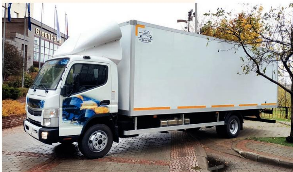
Красивые фирменные наклейки в передней и на боковых сторонах кабины дополнительно защищают ее металлические части от царапин и мелких повреждений

Наконец, на крыше кабины FUSO Canter Energy установлен спойлер с возможностью регулировки по высоте, что бывает необходимо при использовании рефрижератор-