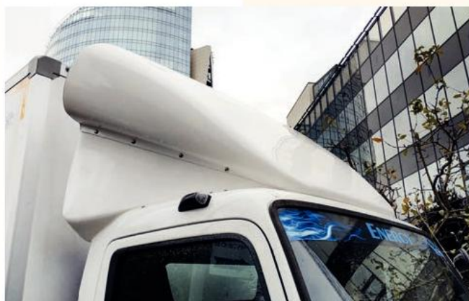
Верхнюю часть установленного над кабиной спойлера, фиксируемую с помощью болтового соединения, можно перемещать относительно его нижней части

разъема которого можно менять в зависимости от размера холодильной установки.