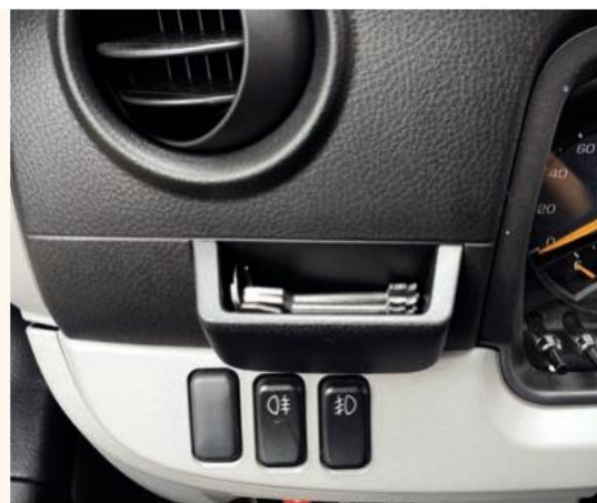
Слева от приборного щитка можно увидеть небольшой карман, который удобно использовать, к примеру, для хранения ключей

ного кузова с выступающей вперед холодильной установкой. Для этого спойлер разделен на верхнюю и нижнюю части, зафиксированные с помощью надежного болтового соединения, местоположение