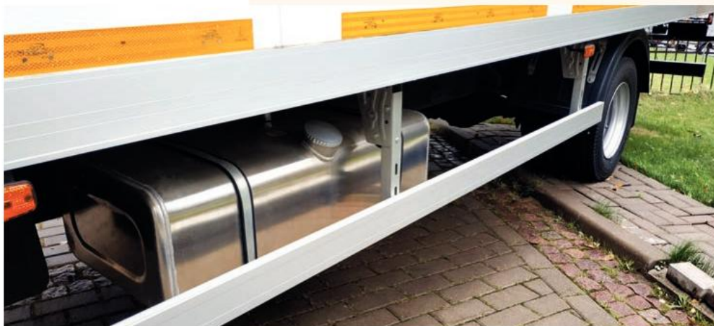
Слева на раме FUSO Canter Energy смонтирован дополнительный 160-литровый топливный бак

Справа сверху от рулевого колеса расположен тахограф, включенный в число базового оборудования грузовиков лимитированной серии. Рычаг КПП размещен на приливе приборной панели, что упрощает перемещение водителя с одной стороны кабины в другую