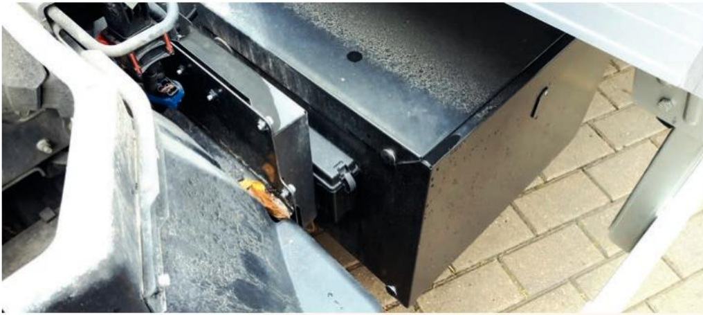
Аккумуляторы FUSO Canter Energy укрыты прочным железным коробом

отличие от последнего, дизель FUSO Canter Energy, даже несмотря на повышение выходных характеристик, сохранил соответствие экологическому стандарту Евро-5 без использования системы SCR, то есть системы избирательного каталитического восстановления, что значительно упростило конструкцию его выпускной системы и снизило эксплуатационные расходы перевозчиков, которым не придется